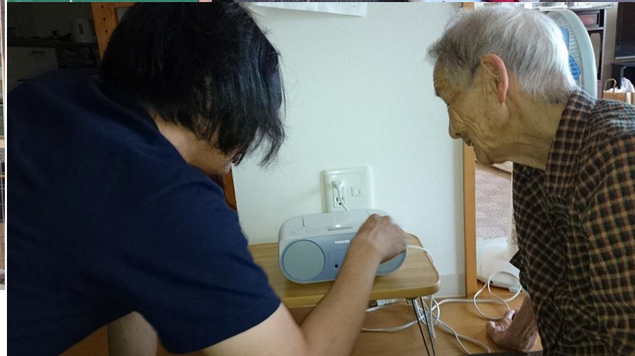
■ ラジオ下神白プロジェクト —あのときあのまちの音楽からいまここへ— 福島県いわき市（2016年—現在）