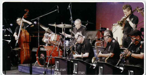
流山ジャズフェスティバル「猪俣猛ジャズオーケストラ」