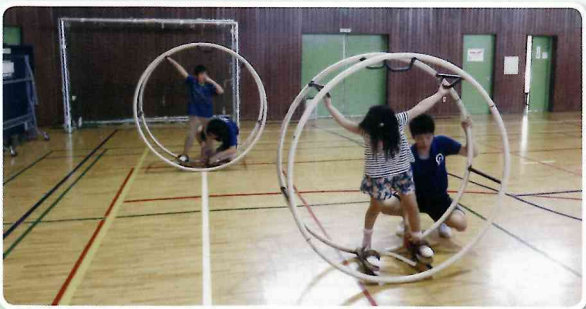
セントラルパークフェスタ「ラート体験」

流山市も都市開発が進み、子育ての街として発展してきており、近年は子育てに力を入れた講座・イベントなども開催しております。また地域・消防・警察・企業との連携事業で防災フェスをを行い、防災にも力を入れています。