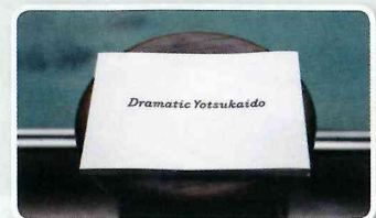
写真集「ドラマチック四街道」

その他、映像「ドラマチック四街道」や、四街道のストーリーを紡ぐ市民や団体へのインタビュー動画「まちのストーリー」などを同プロジェクトのWebサイトやYouTubeなどで公開しています。四街道を知って好きになってもらうだけでなく、それぞれの地域の大切なことに気付くきっかけになるかもしれません。ぜひご覧ください。