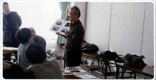
アルバムで講座の振り返り