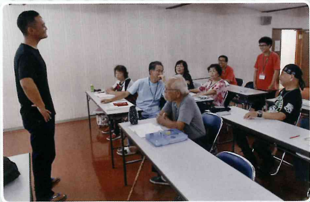
大人の英会話教室

そして中央公民館は、「いつでも、どこでも、誰でも」が学習の機会や意欲を高められるよう地域を結ぶ生涯学習の環境づくりに努めています。